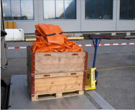
Ausgleichsbecken - 32'000 L - Durchmesser ca. 6 m

Betriebsfeuerwehr Militär Mels Logistikcenter Mels