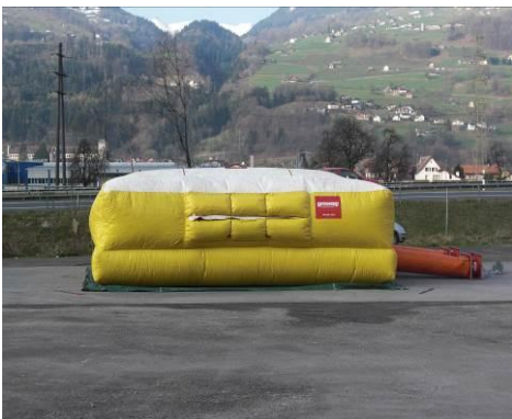
Sprungretter - 8m x 5m - Notstromaggregat

Betriebsfeuerwehr Militär Mels Logistikcenter Mels